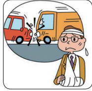
交通事故により、後遺障害が生じた。