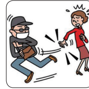
バッグをひったくられた。

偶然な事故により、被保険者（保険の対象となる方）の居住する建物外で被保険者が携行している被保険者所有の身の回り品に損害が生じた場合に補償します。