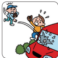
他人の車の窓ガラスを割った。