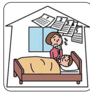
ひき逃げで重度後遺障害が生じた。