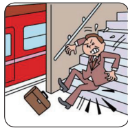
仕事中にケガをして、通院した。