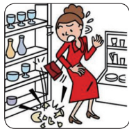
買い物中に商品を壊した。