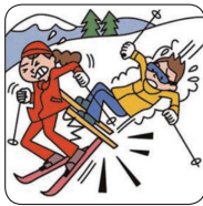
スポーツ中にケガをして入院した。