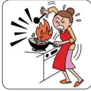
料理中にケガをして通院した。

日本国内・国外を問わず家庭、職場、旅行中など、日常生活におけるさまざまなケガを補償します。