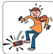
借りていたゲーム機を壊した。