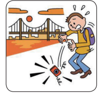
カメラを落として壊した。

*急激かつ偶然な外来の事故によるものをいいます。 「急激かつ偶然な外来」の条件を満たさないケガ（靴ずれ、しもやけ、日やけ、野球肘、テニス肘、疲労骨折、各種職業病など）は対象になりません。