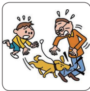
飼犬が他人にケガを負わせた。

日本国内・国外を問わず日常生活におけるさまざまな法律上の損害賠償責任を補償します。 示談交渉は損保ジャパンがお引き受けいたします（国内の事故のみ）