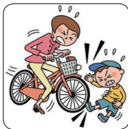
自転車で走行中歩行者にぶつかりケガを負わせた。